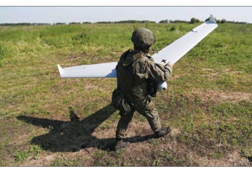
جندي روسي يجهز طائرة استطلاع جوية بدون طيار لإطلاقها بالقرب من بلدة بوياسنا في منطقة لوهاانسك.

وقال زيلينسكي النصر سيكون حليفنا، وفقاً لفرانس برس. وأضاف في مقطع الفيديو، وإلى جانبه رئيس الحكومة دينيس شميغال وزعيم الأغلبية البرلمانية ديفيد أراخاميا ورئيس مكتب الرئاسة أندري يرمك والمستشار الرئاسي ميخائيل بوذيليك؛ ممثلو الدولة هنا ويدافعون عن أوكرانيا منذ 100 يوم. أما الأمم المتحدة، فقالت بعد 100 يوم على اندلاع حرب أوكرانيا إنه لن يتصر أي طرف في هذه الحرب. وقال مساعد الأمين العام للأمم المتحدة ومنسق الأمم المتحدة لشؤون أوكرانيا أمين عوض في بيان لا يوجد منتصر ولن يكون هناك أي طرف منتصر في هذه الحرب. بدلا من ذلك، شهدنا على مدى مئة يوم ما تمت خسارته: حياة أشخاص ومنازل ووظائف وفرص، بحسب الوكالة الفرنسية. ويأتي ذلك في وقت أعلنت كييف أن موسكو باتت الآن تسيطر على 20 في المئة من الأراضي الأوكرانية، بما فيها القرم وأجزاء أخرى من دونباس.