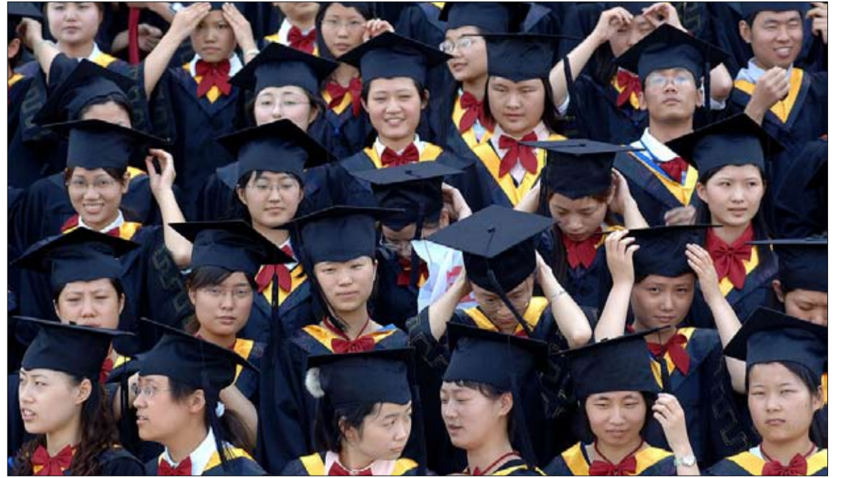
على نحو متزايد، تنتظر المؤسسات والطلاب على حد سواء تصنيفات الجامعات بفارغ الصبر

الجامعات الصينية الكبرى في تحسين ترتيبها في السنوات القادمة. بعد أن اكتسبت بعض المكانة العالمية من خلال صعودها السريع في التصنيف الدولي، فقد ترى هذه الجامعات مكاسب قليلة من الاقتصار على الاقتراب من السقف دون أن تكون قادرة على الوصول إلى القمة.