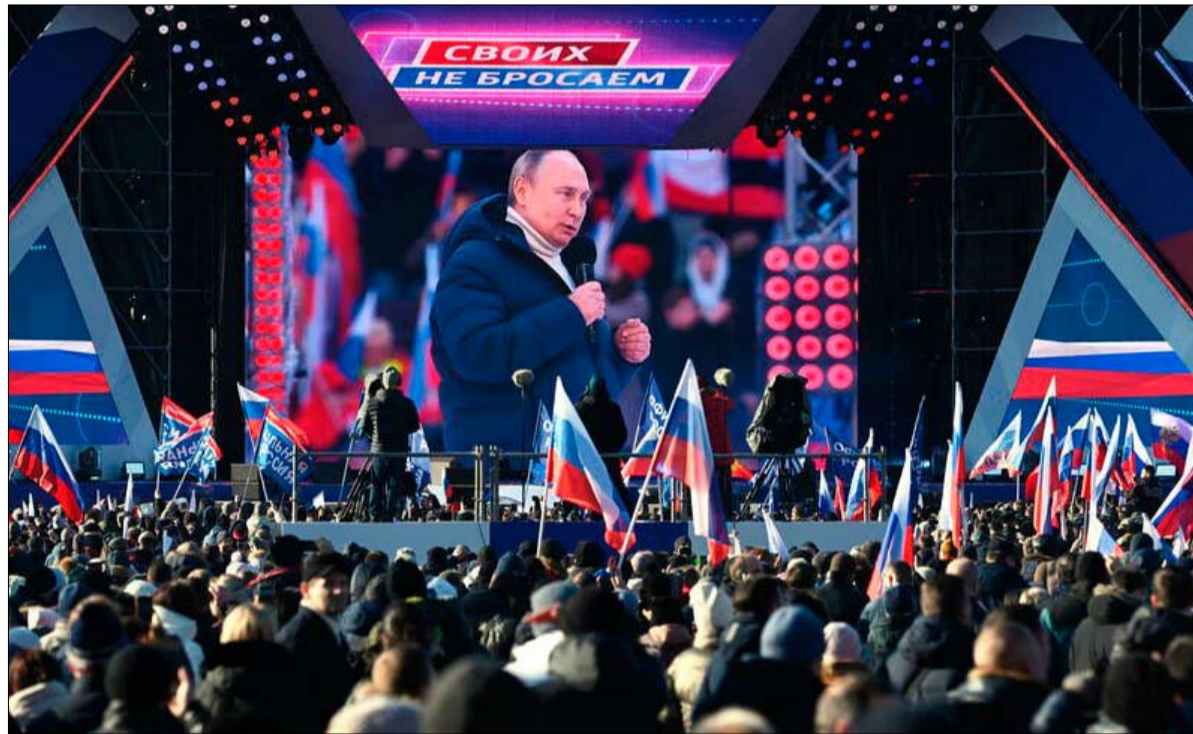
بوتين في وان مان شو

ومع ذلك، كان هذا الدعم لأوكرانيا متوقفاً. وفي ظل هذه الظروف، أتم يكن من الأفضل تركيز الجهود على مناطق من العالم من المحتمل أن تقدم دعماً أقل لأوكرانيا، والتي يمكن أن يكون فيها الرأي العام أكثر تقيلاً للحجج التي تنقلها حملة اعلامية ينظمها الكرملين؟ تم تأكيد أهمية هذا السؤال من خلال تحليل تصويت 2 مارس 2022 في الأمم المتحدة، تمت دعوتهم للتصويت عن القرار