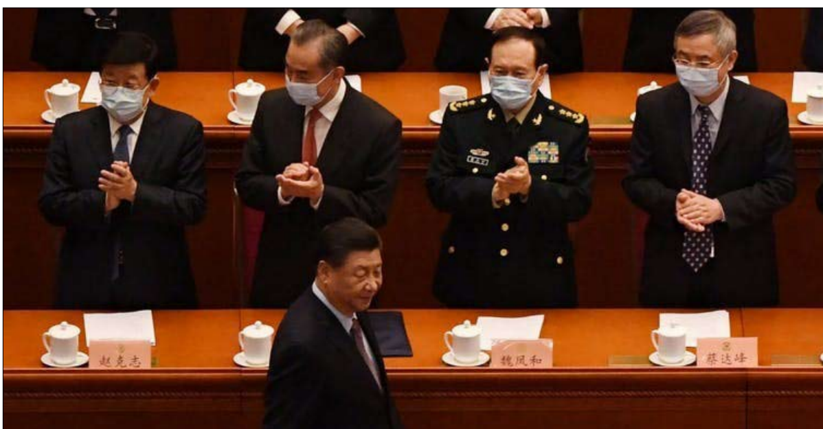
الرئيس الصيني شي جين بينغ في حفل افتتاح المؤتمر الاستشاري السياسي للشعب الصيني