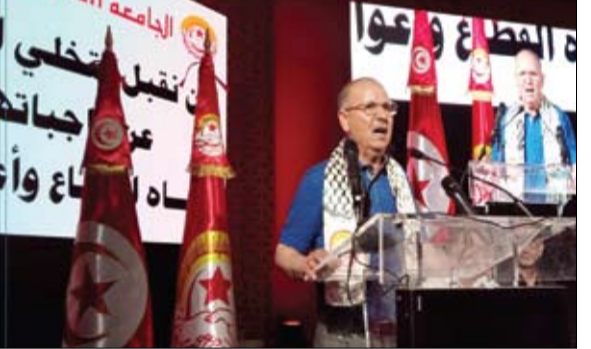
الفجر - تونس

عبر عدد من المنظمات والأحزاب السياسية والشخصيات السياسية والإعلامية والوطنية عن رفضهم المشاركة في اللجنة الاستشارية للشؤون الاقتصادية والاجتماعية صلب الهيئة الوطنية الاستشارية من أجل جمهورية جديدة، والتي تنطلق أعمالها اليوم السبت، رغم توجيه الدعوات لهم. وقد كشف الأمين العام للاتحاد العام التونسي للشغل نور الدين الطيبي، في كلمة ألقاها أمس الجمعة، خلال اجتماع عام للهيكل النقابي لقطاع النقل، إن المشرفين على لجان الحوار الوطني اتصلوا بالأمين العام