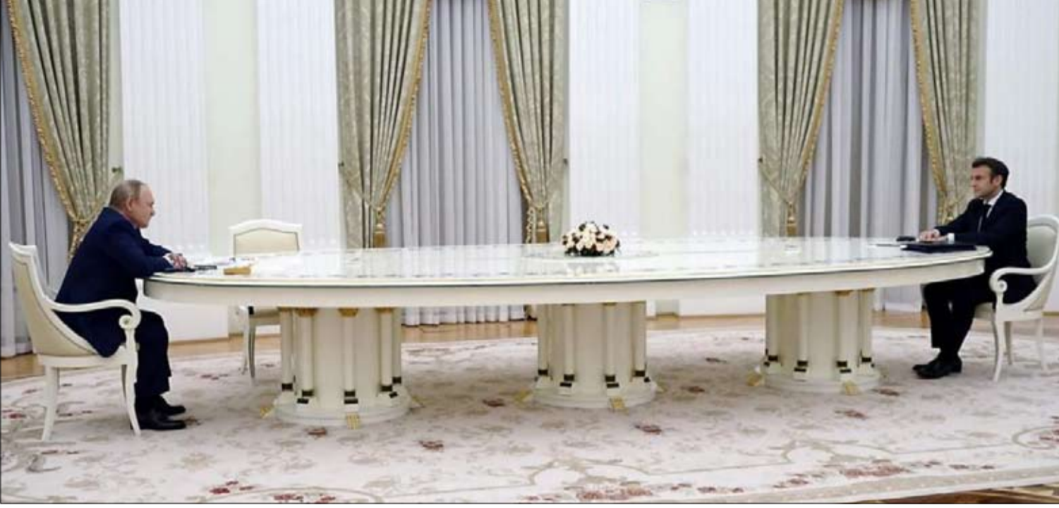
مسافة تقول الكثير

إلى طريقتين للاتصال متعارضتين جذرياً. كسر قواعد الرئاسة من خلال الظهور بقمصان كافي، والسير في الشوارع، وتصوير نفسه، والتأكيد على قربه من السكان، والتدخل محاطاً بأعضاء حكومته في كثير من الأحيان وهم يرتدون ملابس عسكرية،