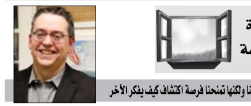
آراء لا تزالها ولكنها تمنحنا فرصة اكتشاف كيف يفكر الآخر

بلاكسيت، جو بايدن ومشكلة السود... لوك لالبيرتي لا تنقص إدارة بايدن التحديات والمخاوف. ان أوكرانيا والصين والتنظيم والهجرة وجرائم القتل الجماعي ونسبة الشعبية المتدنية، تكني لاحتكار جميع الموارد. تضاف إلى هذه المشاكل مشكلة جديدة غير متوقعة: نزوح حقيقي للموظفين السود من البيت الأبيض. انهم 21 شخصاً تركوا السفينة وأعلنوا مغادرتهم. وتثير هذه الحركة الاستغراب. عندما أدى الرئيس السادس والأربعون اليمين الدستورية، كان معدل تمثيل أولئك الذين تم تحديدهم على أنهم سود في طاقم العمل مرتفعاً جداً قبل أن ينخفض تدريجياً إلى 14 بالمائة في مايو 2022. ووفق موقع بوليتيكو، فإن هذه الظاهرة مهمة ولافتة إلى درجة الإشارة إليها بتعبير: الـ "بلاكسيت".