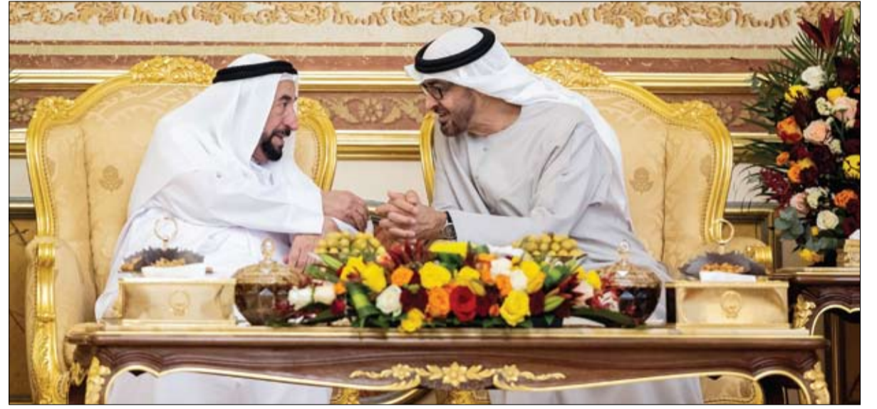
رئيس الدولة خلال زيارته حاكم الشارقة (وام)