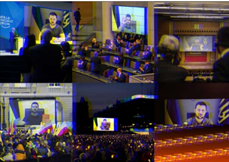
خطاب لكل جمهور وما يطلبه المستمعون