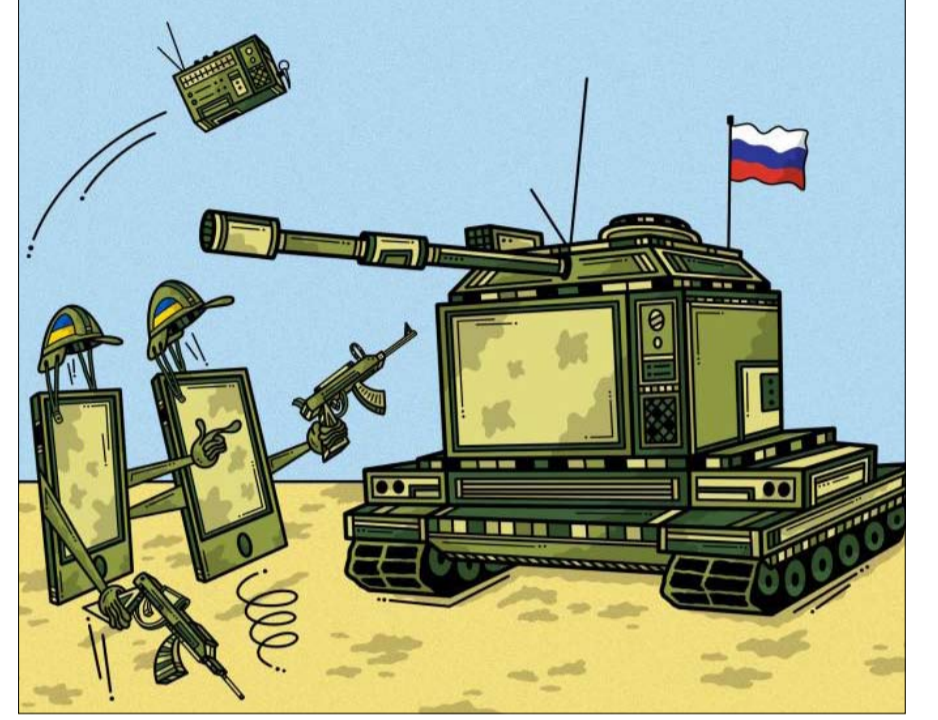
الحرب اعلامية ايضا

الذي يطالب روسيا بوضع حد فوري لهجومها على أوكرانيا، امتنع عشرات الدول من الشرق الأوسط وأفريقيا وآسيا عن التصويت.