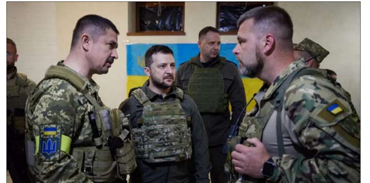
حضور على الميدان