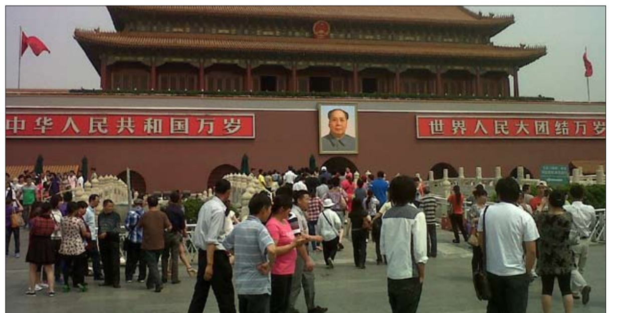
البحث عن التميز بطريقة صينية