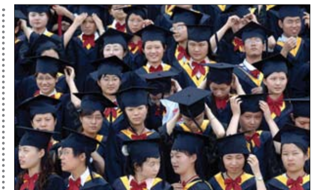
على نحو متزايد، تنتظر الإسات والطلاب على حد سواء تصفيحات الجامعات بفرار الصبر

قال الجيش الروسي أمس الجمعة، إنه شن المزيد من الضربات الصاروخية والمدفعية في أوكرانيا، الليلة الماضية بالإضافة إلى ضربات جوية. وأعلنت وزارة الدفاع في موسكو القضاء على أكثر من 360 قوياً وتدمير 49 نظام أسلحة، والمركبات العسكرية. وذكر المتحدث باسم الوزارة إيغور كوناشينكوف أن محطة إذاعية للمراقبة في سلوفيانسك، كانت من بين الأهداف المدمرة. وأضاف كوناشينكوف أن الثيران الروسية استهدفت أيضاً أربعة مستودعات ذخيرة في دونباس، وعشرات الأهداف في منطقة ميكولايف الجنوبية. ولم يتسن التحقق من المعلومات من مصادر مستقلة. إلى ذلك، قال المتحدث باسم الرئاسة السورية الكرملين دميتري بيسكوف، أمس الجمعة، إن روسيا ستواصل عملياتها العسكرية في أوكرانيا حتى تتحقق جميع أهدافها. وأضاف بيسكوف في اليوم المئة