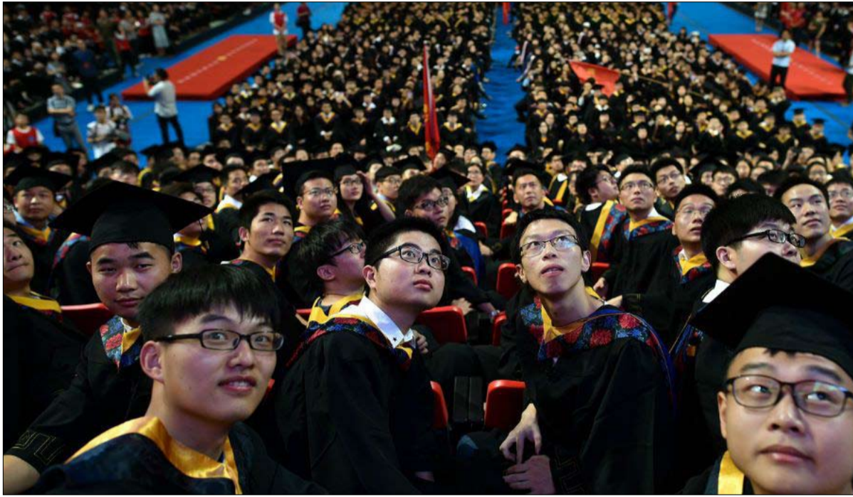
حفل تخرج في جامعة هواتشونغ للعلوم والتكنولوجيا في ووهان

أعلنت ثلاث جامعات صينية يوم 9 مايو عزمها "الانسحاب من التصنيف العالمي". هذا الإعلان، الذي نشرته وسائل الاعلام الرسمية الوطنية،